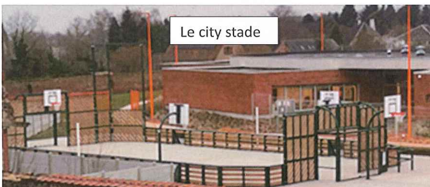
Le city stade