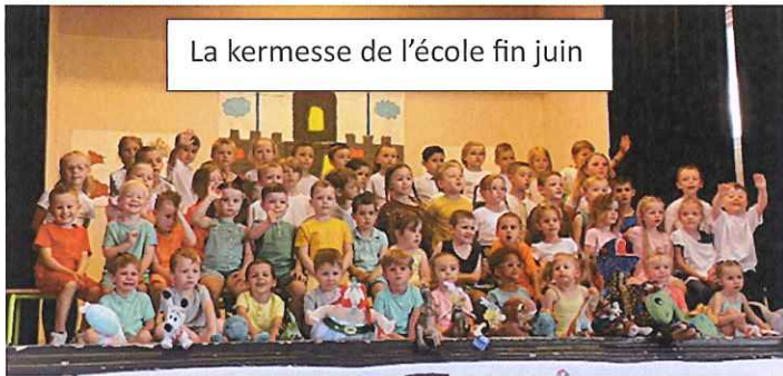
La kermesse de l'école fin juin