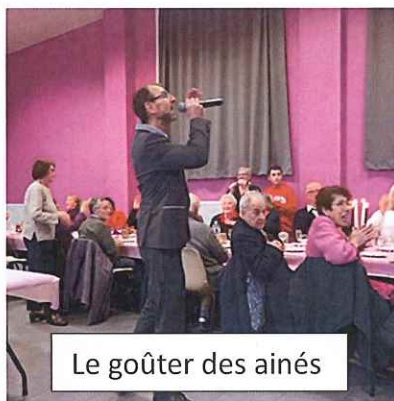
Le goûter des aînés