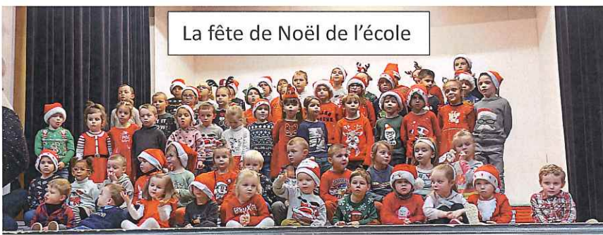
La fête de Noël de l'école