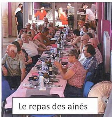
Le repas des aînés