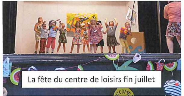
La fête du centre de loisirs fin juillet