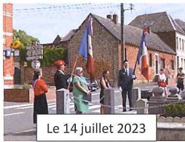
Le 14 juillet 2023