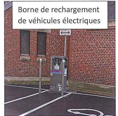
Borne de recharge de véhicules électriques