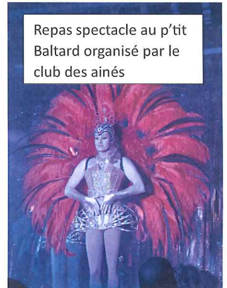
Repas spectacle au p'tit Baltard organisé par le club des aînés

NOUVEAU : en plus de l'aide au permis, de la prime au BAC pour nos jeunes, la municipalité a décidé de mettre en place le dispositif « Argent de poche ». Les jeunes de 16 et 17 ans pourront bénéficier de 15€ d'argent de poche en contrepartie de 3 heures de travaux sur la commune. (Renseignements en Mairie)