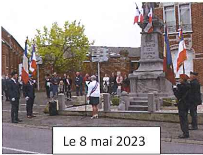
Le 8 mai 2023