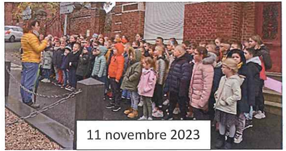
11 novembre 2023