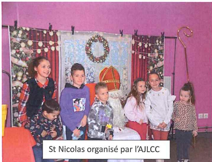
St Nicolas organisé par l'AJLCC